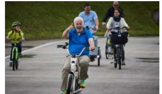
🚲 Große Teststrecke