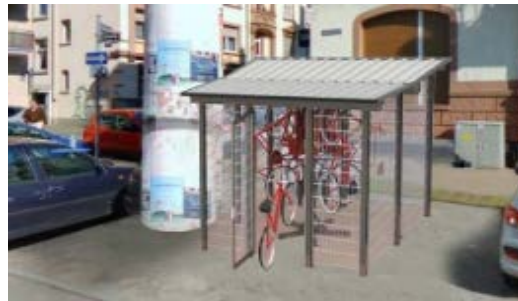
🚲 Mobil in Hamburg